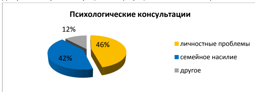
Диаграмма 3. Причины обращаемости (в процентном соотношении)

С февраля 2016г. в КЦ «Сезим» начал работать детский психолог. В основном обращаются родители с детьми от 3 до 15 лет, которые оказываются свидетелями или жертвами насилия в семье. Детский психолог предоставляет заключения о психологическом состоянии детей в судебные и следственные органы, проводит занятия с детьми и матерями, групповую и индивидуальную психотерапию.