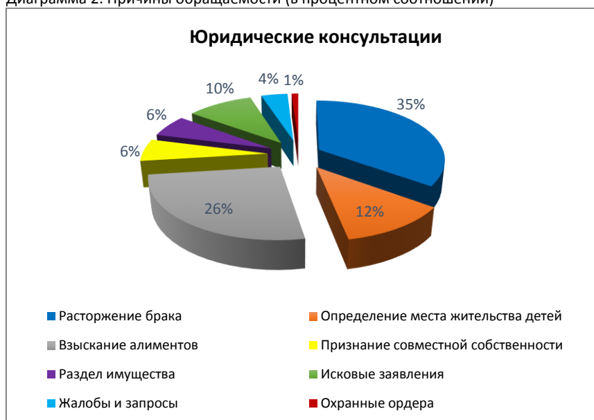
Диаграмма 2. Причины обращаемости (в процентном соотношении)

В 23 судебных делах вынесены решения в пользу клиентов КЦ «Сезим».