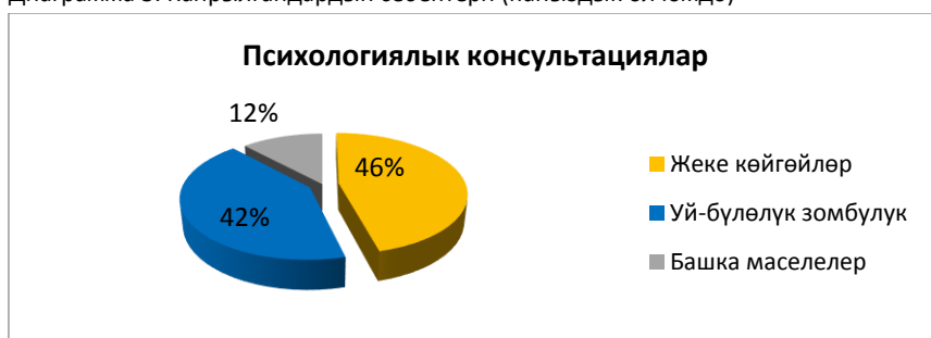
Диаграмма 3. Кайрылгандардын себептери (пайыздык өлчөмдө)

2016-жылдын февраль айынан тарта «Сезим» КБ балдар психологу иштеп баштады. Негизинен үй-бүлөлүк зомбулуктун күбөлөрү болгон 3-15 жашка чейинки балдардын ата энелери кайрылышат. Балдар психологу соттук териштирүүлөр менен тергөө амалдары үчүн бүтүм чыгарып берет. Ошондой эле, балдар жана алардын ата-энелерине жекече психологиялык жардам көрсөтүп, Шелтерде балдар тобу менен иш алып барат.