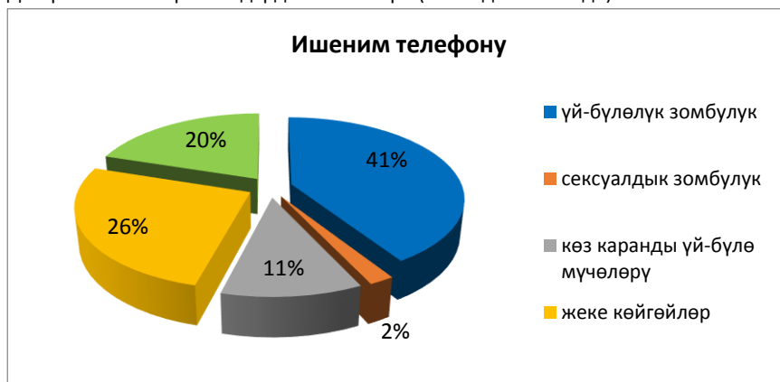
Диаграмма 1. Кайрылгандардын себептери (пайыздык өлчөмдө)

Кайрылган аялдардын басымдуулугу гендердик, үй-бүлөлүк, сексуалдык зомбулуктан, психотроптук жана кумар оюндарынан жабыркагандардан көз карандылык, жеке көйгөйлөр (стресс, депрессиялык абал) боюнча кайрылгандар. Эркектер – жеке мамилелер жана маалымат алуу (анын ичинде кризиске кабылган туугандарына, жакындарына жардам көрсөтүү) максатында кайрылышкандар.