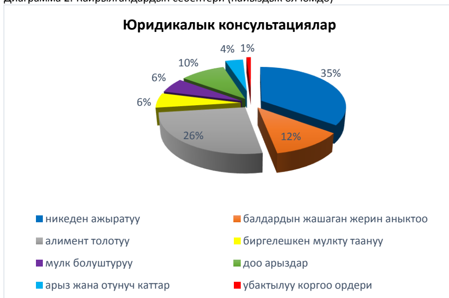
Диаграмма 2. Кайрылгандардын себептери (пайыздык өлчөмдө)